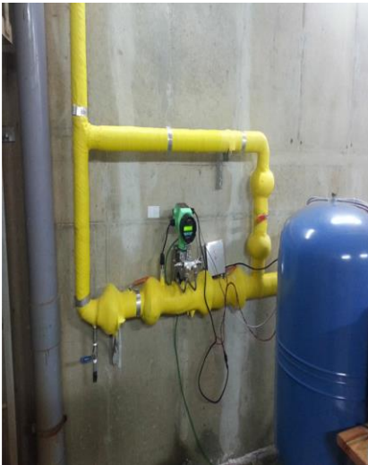
도시철도공사 Water, 50A 라인 FN질량유량계