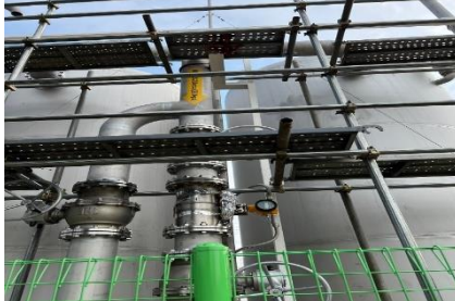
㈜극동화학 군산공장 바이오가스 거래용, 125A 라인 FN질량유량계