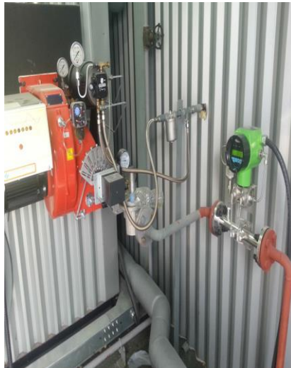
이천(잔존사체처리시스템) LPG, 25A 라인 FN질량유량계